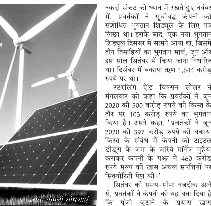
स्रोत: कंपनी घोषणाएं

यह दूसरी बार है जब प्रवर्तकों ने ऋण के लिए संशोधित भुगतान शिड्यूल की मांग की है। यह कंपनी की सूचीबद्धता से पहले