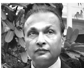
■ अनिल अंबानी की व्यक्तिगत गारंटी को धुनाने का मामला

एसबीआई ने अपनी याचिका में कहा है कि व्यक्तिगत गारंटी को धुनाए जाने के बाद कई प्रवर्तकों ने दिल्ली उच्च न्यायालय का रुख किया है।